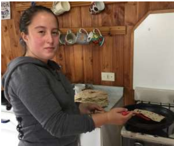
kookles tijdens een logeerpartij bij het team

Ze hebben een fors deel van de kosten uit eigen zak betaald. Uiteraard is dit niet wenselijk en we denken ook niet houdbaar op lange termijn, omdat ze al van een minimale persoonlijke toelage moeten rondkomen. Het geeft wel de motivatie en passie van het Chileense team aan.