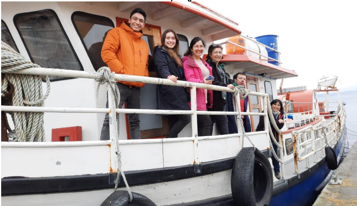
het team op weg naar de eilanden